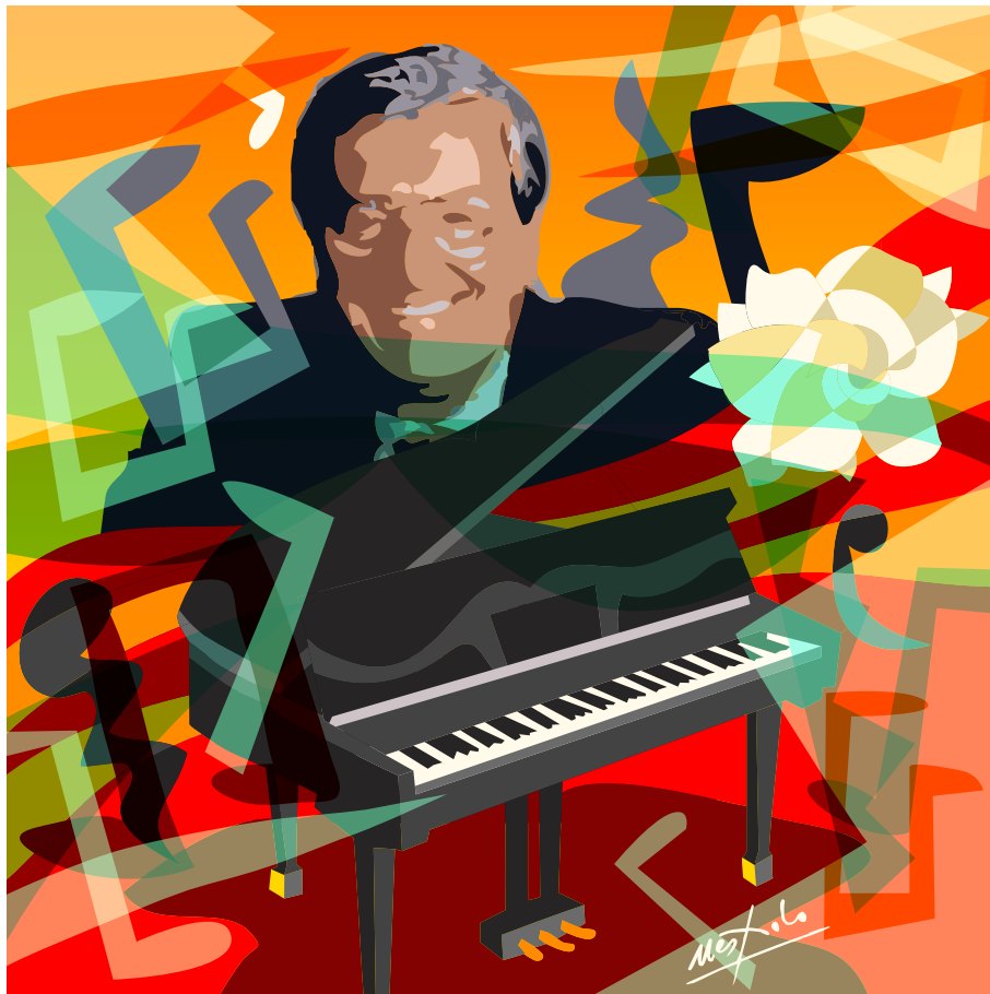
Copertina dell'artista Ugo Nespolo (Copyright)